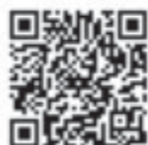
とちぎ結婚支援センター ホームページQRコード