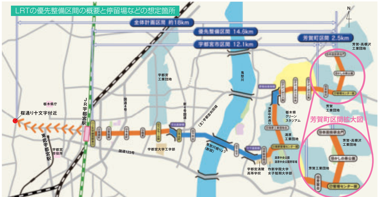
LRTの優先整備区間の概要と停留場などの想定箇所