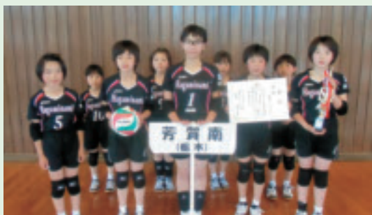
▲芳賀南バレーボールクラブ