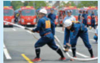
▲まずは1つ目の火点