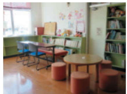
▲教育支援センターの室内