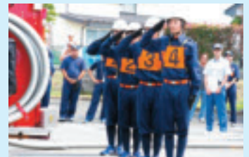
▲最後まで気は抜けない