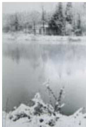
▲鈴木正一郎「唐桶の詩」