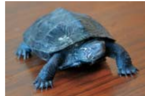
モモちゃん(亀・4歳)