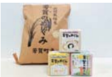
〈町産米パッケージ作成〉