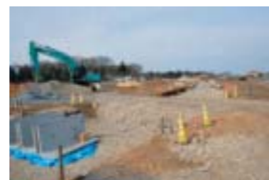
〈造成工事の進む祖陽が丘〉