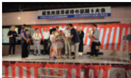
▲下延生自治会(アルミ製ステージ)