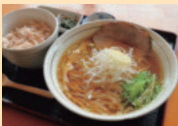
▲醤油ら一麺+鶏飯セット