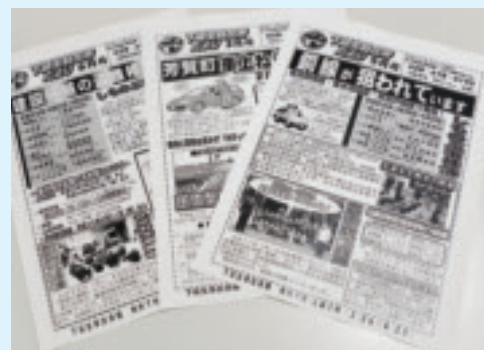
▲入賞した「下延生駐在所だより」