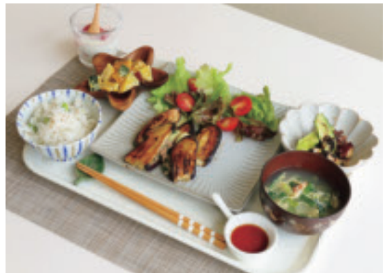
▲コンクール当日に作った料理