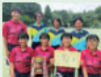
▲女子ソフトテニス部