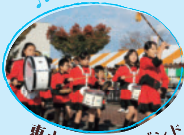
東小マーチングバンド

文化部門：2018.11.9(金)~11.11(日) 作品展示【農業者トレーニングセンター・町民会館】