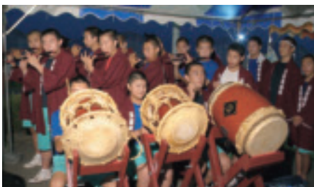
▲祖母井自治会(太鼓・はんでん)

そこで、一般財団法人自治総合センターが宝くじの社会貢献広報事業として実施している平成30年度コミュニティ助成事業を活用し、新しい太鼓、はんでん、アルミ製ステージを購入しました。