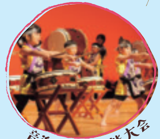
音楽・伝統芸能大会