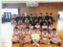
▲バスケットボール部