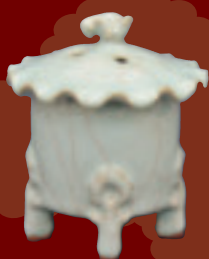
The world of MIYABI