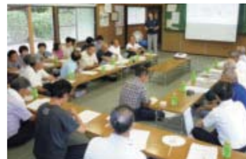
▲健康づくりモデル地区事業(上給地区)