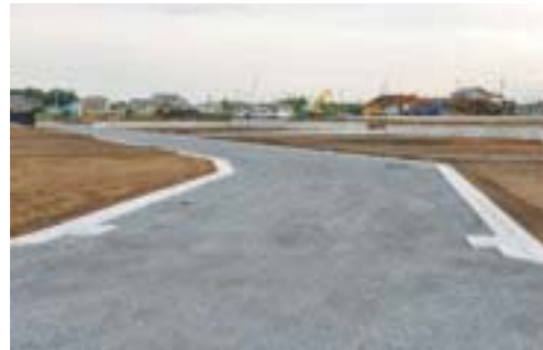
▲祖陽が丘の宅地造成