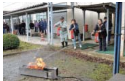
▲防災訓練(稲毛田地区)