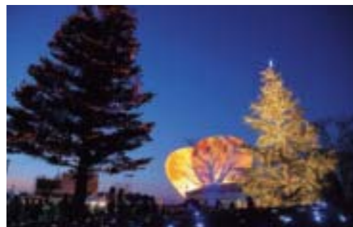
▲HAGAグルミネーションフェス(観光協会主催)