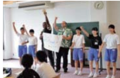
▲イングリッシュキャンプ(芳賀中)