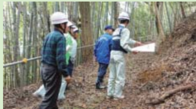
▲土砂災害危険箇所の点検

in 西高橋構造改善センター 避難訓練や避難誘導訓練を実施。その後、真岡土木事務所と合同で土砂災害危険箇所を点検。