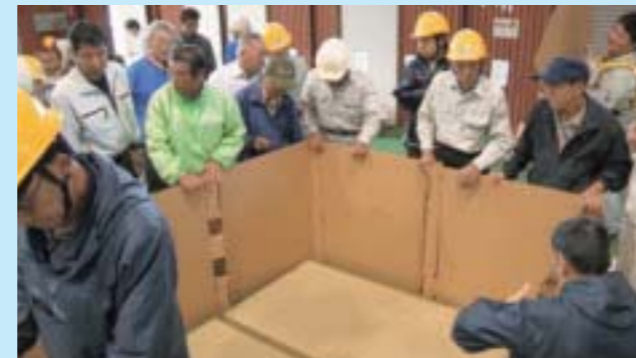
▲間仕切りの設置訓練