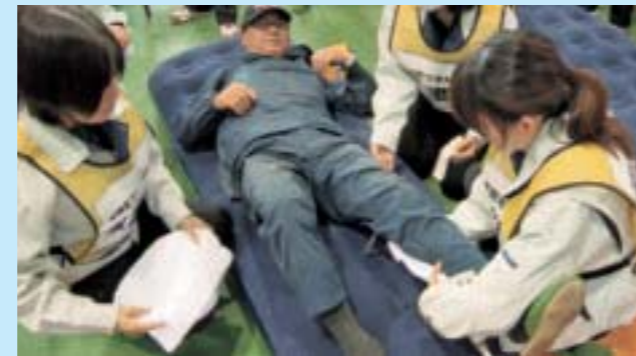
▲けが人の応急手当訓練

in 旧上稲毛田小学校 避難所を開設。避難者カード作成、けが人の応急手当、畳や間仕切りの設置などを実施。