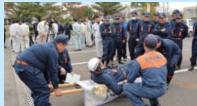
▲負傷者の搬送訓練