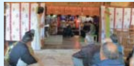
▲11月23日 星宮神社(芳志戸)