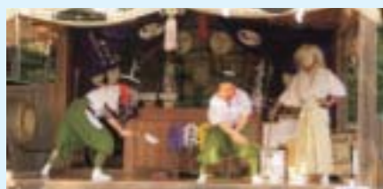
▲11月23日 八雲神社(稲毛田)