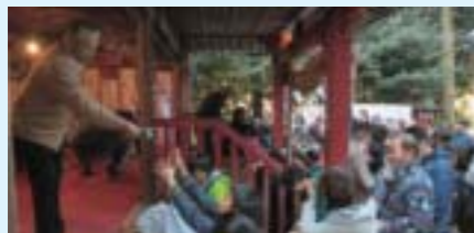
▲11月23日 安住神社(下高根沢)