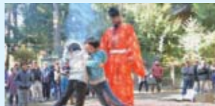
▲11月23日 行事神社(西高橋)