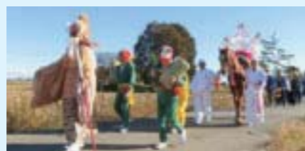
▲11月23日 天満宮(西水沼)