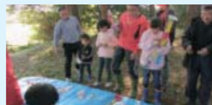
▲11月25日 駒止天満宮(上延生)