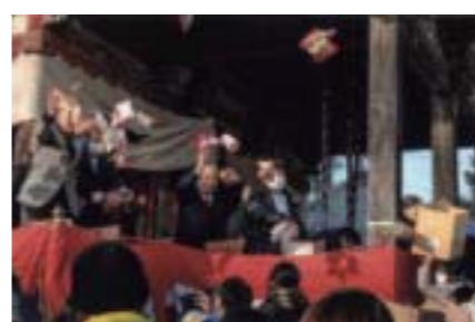
準特選 「延生地蔵尊の豆まき」 島田 俊男(芳志戸) 撮影場所:延生地蔵尊