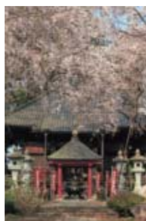
準特選 「桜花爛漫」 大貫 芳雄(市貝町) 撮影場所:崇真寺