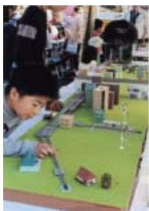
準特選 「LRTはどこ通る。」 船木 肇(宇都宮市) 撮影場所:町民祭会場