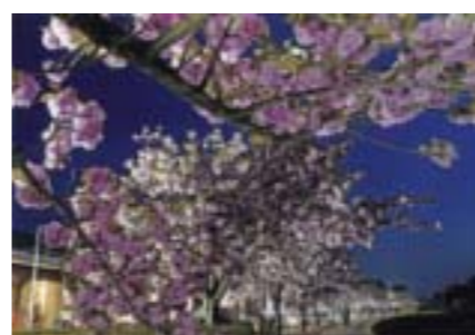
準特選 「薄暮の空、照明に浮くボタン桜」 富永 明(宇都宮市) 撮影場所:芳賀温泉ロマンの湯