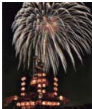
入選 「ロマン花火」 小玉 文男(祖母井) 撮影場所:芳賀温泉ロマンの湯