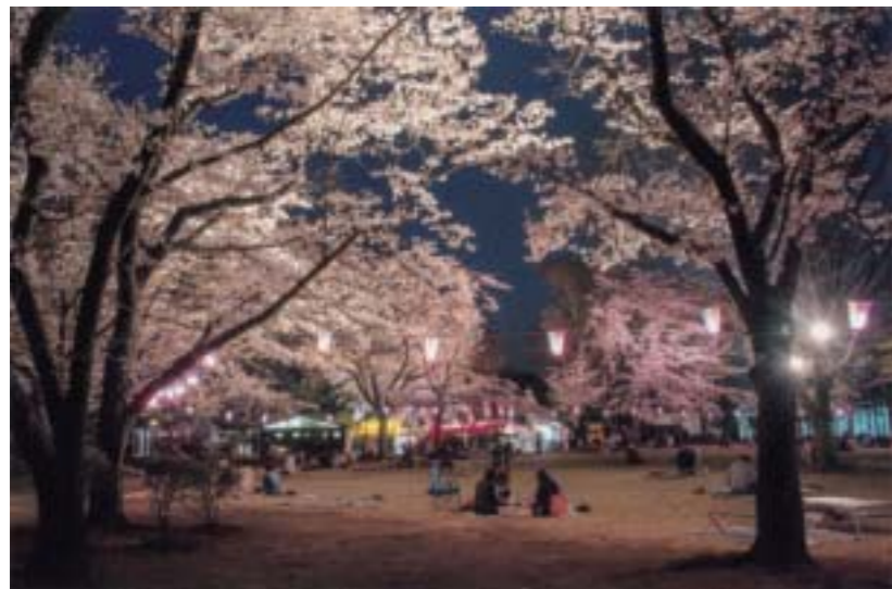
特選 「かしの森公園の夜桜」 古谷 倅一(祖母井) 撮影場所:かしの森公園

講評 夜桜で公園の中の雰囲気は観光写真にぴったりである。桜の花も良く、宴会をしている人も良い。