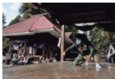
入選 「観客」 江川 多嘉(宇都宮市) 撮影場所:星宮神社