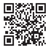
▲こどもの救急ホームページ