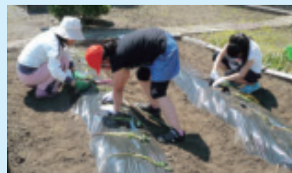
▲活動の様子(さつまいもの苗の植え付け)

A4 個別活動(自ら選んで学習)、仲間づくり活動(スポーツ、ゲーム等)、体験活動(調理、栽培等)です。