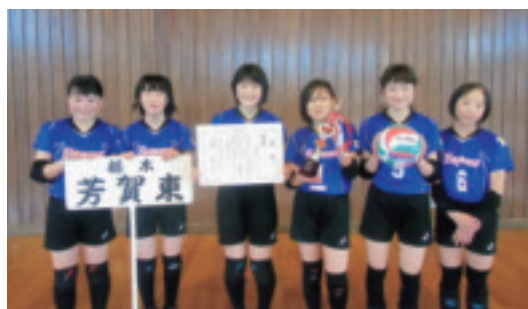
▲芳賀東バレーボールクラブ

会場／町第2体育館 結果／優勝 芳賀東バレーボールクラブ 準優勝 芳賀北バレーボールクラブ 3位 芳賀南バレーボールクラブ