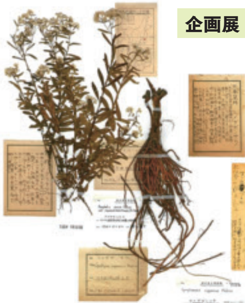
関本コレクション(栃木県立博物館蔵)