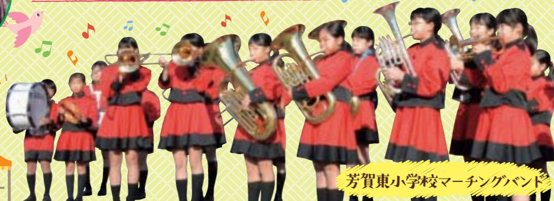
芳賀東小学校マーチングバンド