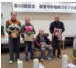
▲男子入賞者の皆さん