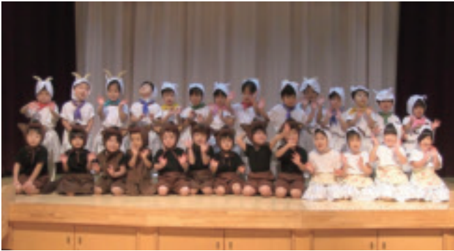
認定ひばりこども園おゆうぎ会（12/20）