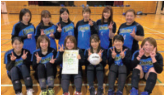
▲祖母井体協婦人バレー