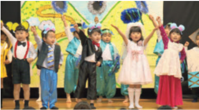
祖母井保育園おゆうぎ会（12/13）