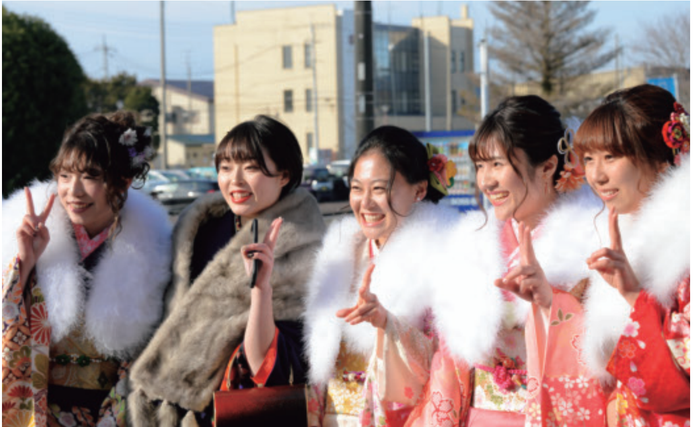
1月12日(日)成人式(町民会館)