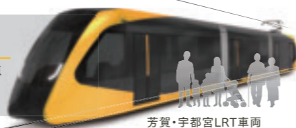
芳賀・宇都宮LRT車両

芳賀・宇都宮LRT整備事業は、平成30年6月から順次工事を進めており、今回芳賀町区間において次の工事を実施します。