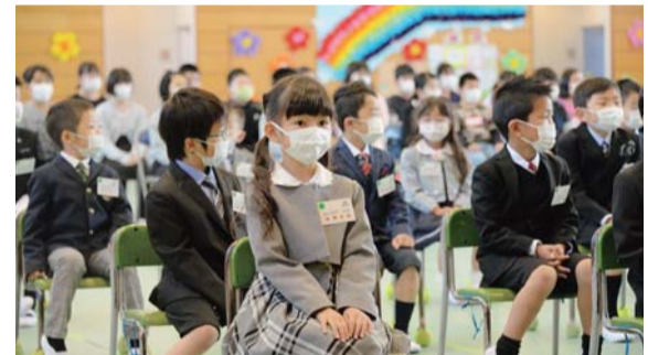
▲安全面に配慮して実施した入学式