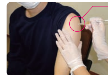
この部分に接種します

ワクチンの接種は肩の近くに行います。 接種の際には、半袖や伸縮性の高い生地等の肩を出しやすい服装でお越しください。