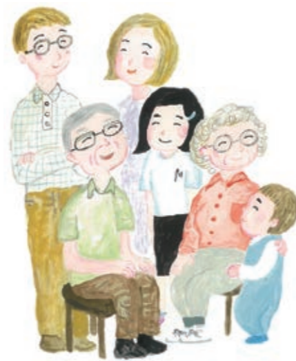
自治会長名簿 (令和3年4月現在) (敬称略)

大規模災害の際には、避難所の開設や安否確認、障害物の撤去など、自治会を中心とした地域での取り組みが大きな力となっています。