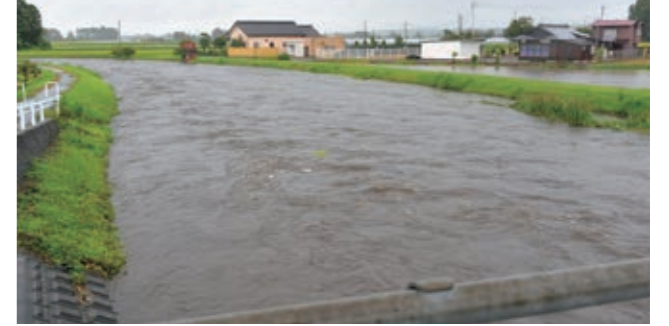
▲平成27年9月大雨(野元川)

災害の状況により、避難方法は変わります。テレビやラジオのほか、インターネットやスマートフォンアプリなどから積極的に最新情報を仕入れながら、身を守る行動を取ってください。