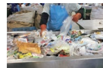
▲プラスチック類分別の様子

家庭から排出されるごみの中に、資源化できるごみはありませんか。「私一人が頑張っても意味がない」ではなく、「まず、私が取り組もう」の意識で、環境に優しい町をつくっていきましょう！