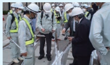
▲11月22日の現場調査の様子

以上を踏まえた 走行調査の実施 車両内に「振動加速度計」を設置し、本線等で車両の挙動測定を行う「走行調査」をさまざまな速度で実施してきました。