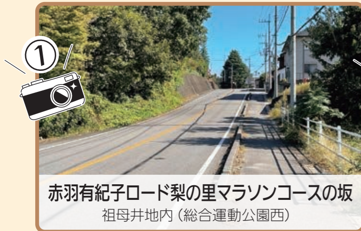
赤羽有紀子ロード梨の里マラソンコースの坂 祖母井地内(総合運動公園西)