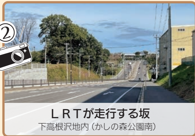
LRTが走行する坂 下高根沢地内(かしの森公園南)