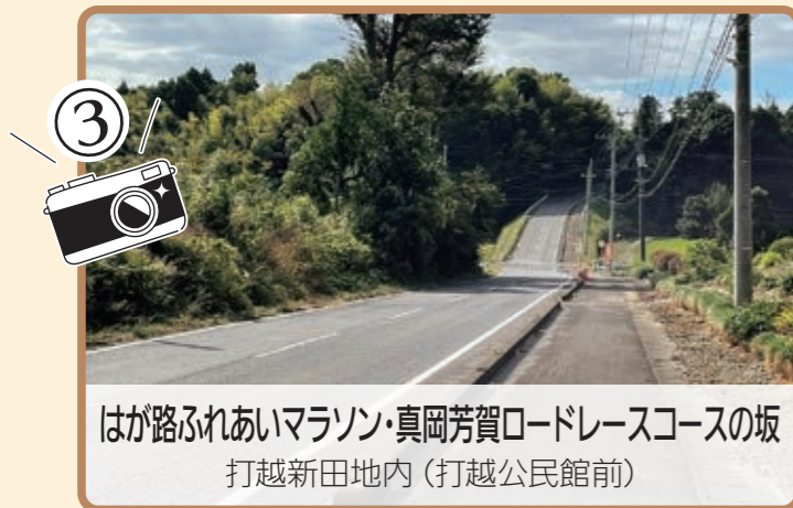
はが路ふれあいマラソン・真岡芳賀ロードレースコースの坂 打越新田地内(打越公民館前)