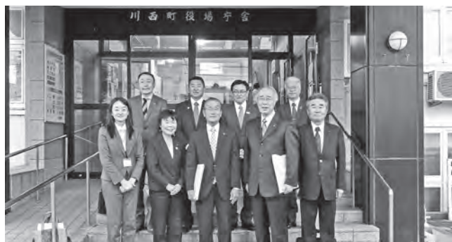
▲川西町議会広報公聴常任委員とともに