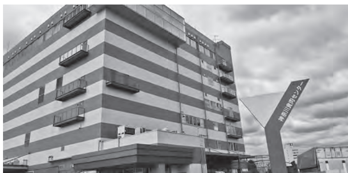
▲神奈川食肉センターの外観

視察では施設運営や水処理状況の説明を受け、今後の建設計画の審査等の参考となる内容でした。