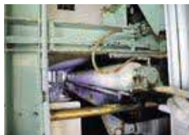
▲故障した汚泥脱水機の内