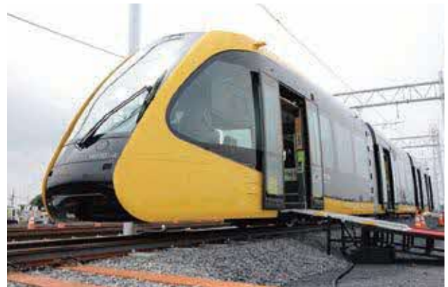
▲5月に納入されたLRT車両「ライトライン」

商工観光課ではPRに向けた記念品にマスク、タオル等を制作しました。ノベルティとしてイベント等で配布する予定です。