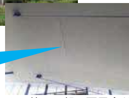
▲天井の一部に不具合が発生し、危険な箇所