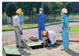
▲汚泥をくみ出す様子

芳賀工業団地排水処理センターでは、工業団地内で操業している約100社の企業が排出している汚水を処理しています。5月中旬に汚水を脱水するための大型脱水装置が故障したため、脱水する前の汚泥を運搬処理する委託料と大型脱水装置を更新するための工事設計委託料を補正しました。