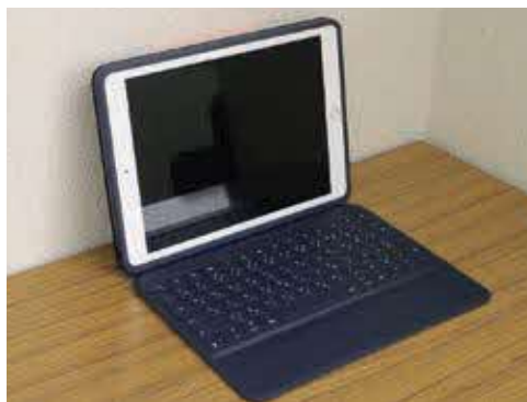
▲学校で使用しているタブレット端末