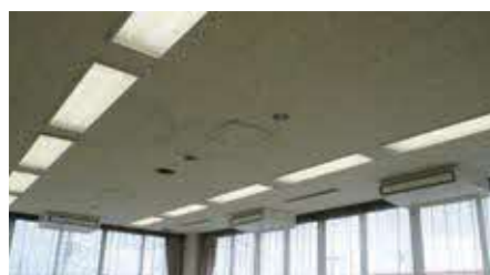
▲新しくなった空調機(保健指導室)