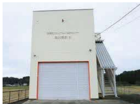
▲改修工事が完了した2-1