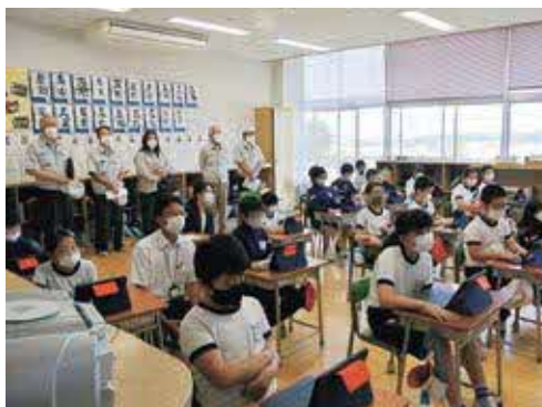
▲ICTを使用した授業の現地調査(芳賀南小)