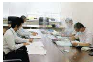
▲書類審査（商工観光課）