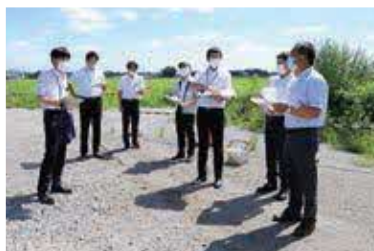
▲現地調査（稲毛田地区ほ場）

令和2年度も普通交付税の不交付団体になりましたが、LRT整備事業計画の見直しによる影響や、芳賀第2工業団地造成・土地改良事業等の進行などによって、今後も歳出の増加が続くと思われるとともに、新型コロナウイルス感染症により、長期の経済的な景気低迷が憂慮されます。引き続き町税収入をはじめとする歳入の確保に最大限努めて、長期的な視点に立った財政運営を図っていただくとともに、人口減少化時代において定住人口の増加と不動産価値を高めた、魅力あふれる住宅地が形成された成功事例の『祖陽が丘』に倣って、活気あふれるまちづくりに邁進されるよう望みます。