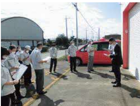
▲改修工事が完了した2-2の現地調査

2-1(下高根沢南部)、2-2(下高根沢北部)の2か所の改修工事を行いました。平成28年度から計画的に実施し、令和3年度で町内全ての消防センターの改修が完了する見込みです。