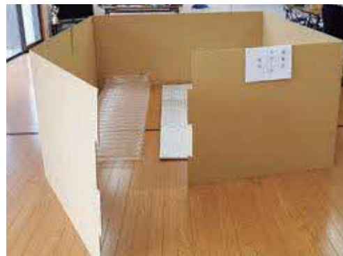
▲配布したダンボールパーティション