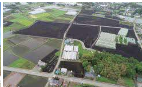
▲上空から見た稲毛田地区ほ場