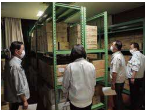
▲旧芳志戸小学校にある備蓄品を現地調査

町総合防災訓練において、消毒液、検温計、段ボールパーティション等を各自主防災組織に配布しました。