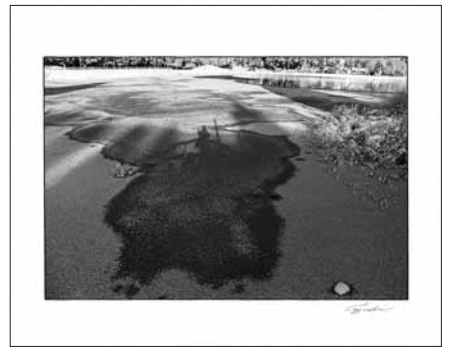
「唐桶の詩」 昭和60年1月30日撮影