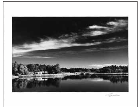
「唐桶の詩」 平成2年8月21日撮影