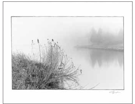
「唐桶の詩」 平成6年3月9日撮影