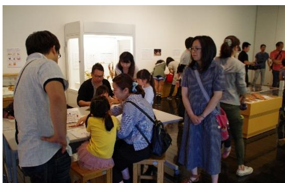
移動博物館関連講座「エビ・カニ・ヤドカリのふしぎ」