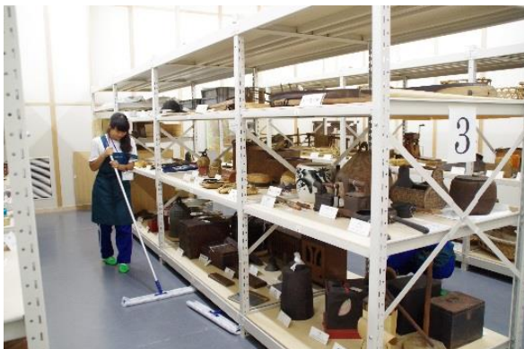
マイチャレ（芳賀中の職場体験）の様子