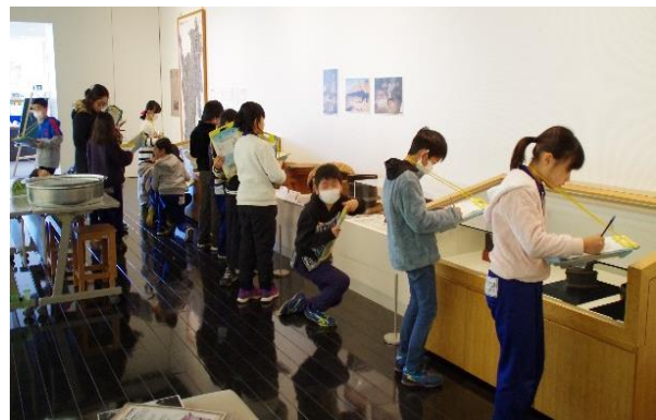
小学 3 年生の校外学習（昔の道具調べ）の様子