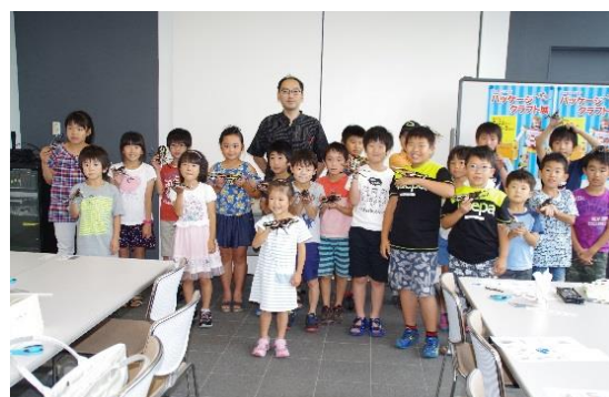
パッケージクラフト展関連ワークショップ