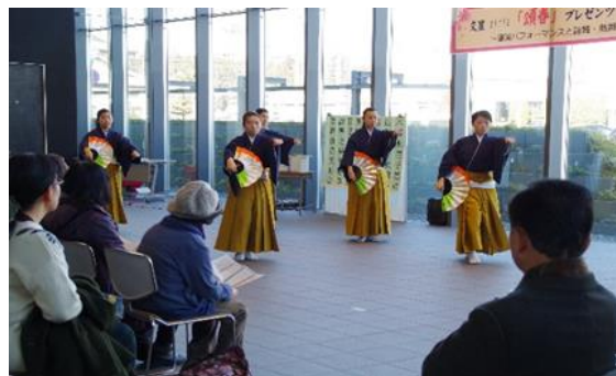
21 新春イベント 文星女子高校生によるパフォーマンス