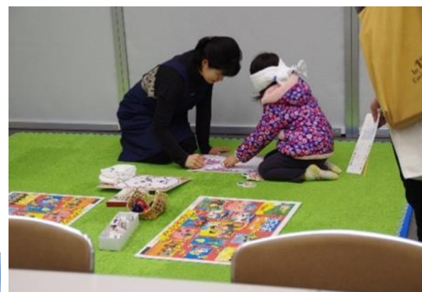
図書館まつりの様子