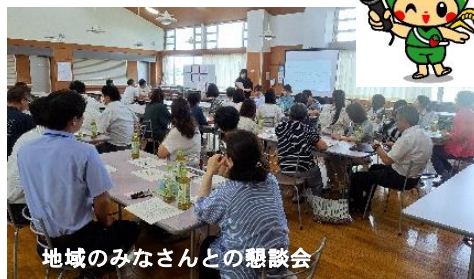
地域のみなさんとの懇談会

8月4日(月)に芳賀北小学校分科会として「地域のみなさんとの懇談会」が開催されました。学校運営協議会委員のほか、芳賀北小学校全職員とPTA役員、スクールサポーターはがきたの方々、他の小学校のボランティアの方々も含め、40名余りが集まりました。町からコミュニティ・スクールについて説明の後、「地域のみなさまと協力して学校でできそうなこと」をテーマに熟議を行いました。とても和やかな雰囲気の中、それぞれの立場や経験を元に