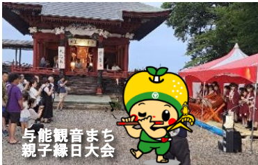
与能観音まち親子縁日大会

7月5日(土)に上延生の加波山神社夏祭り、8月16日(土)に与能の観音まち親子縁日大会で郷土芸能クラブのみなさんがお囃子を披露し、祭りに花を添えました。