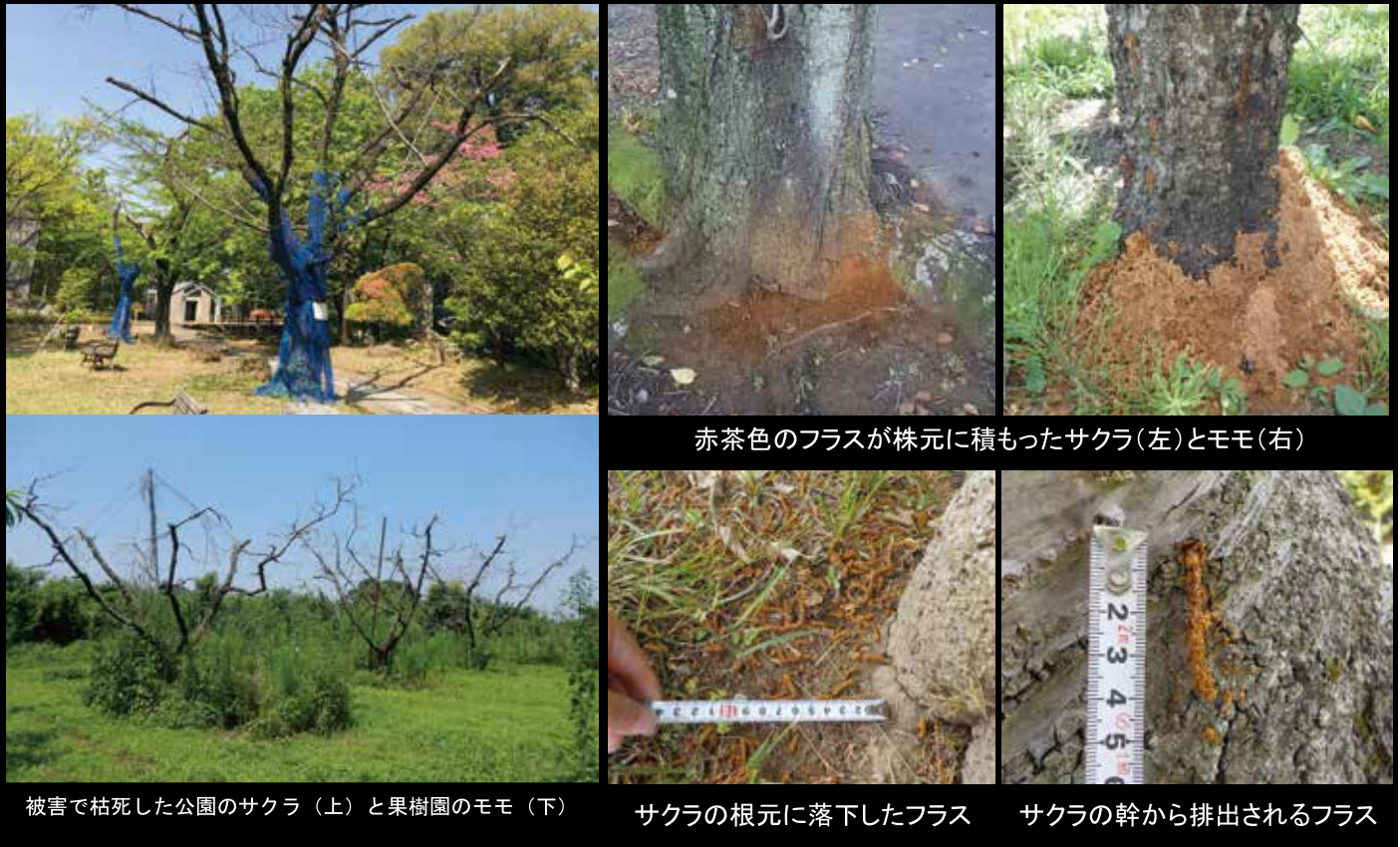
赤茶色のフラスが株元に積もったサクラ(左)とモモ(右)