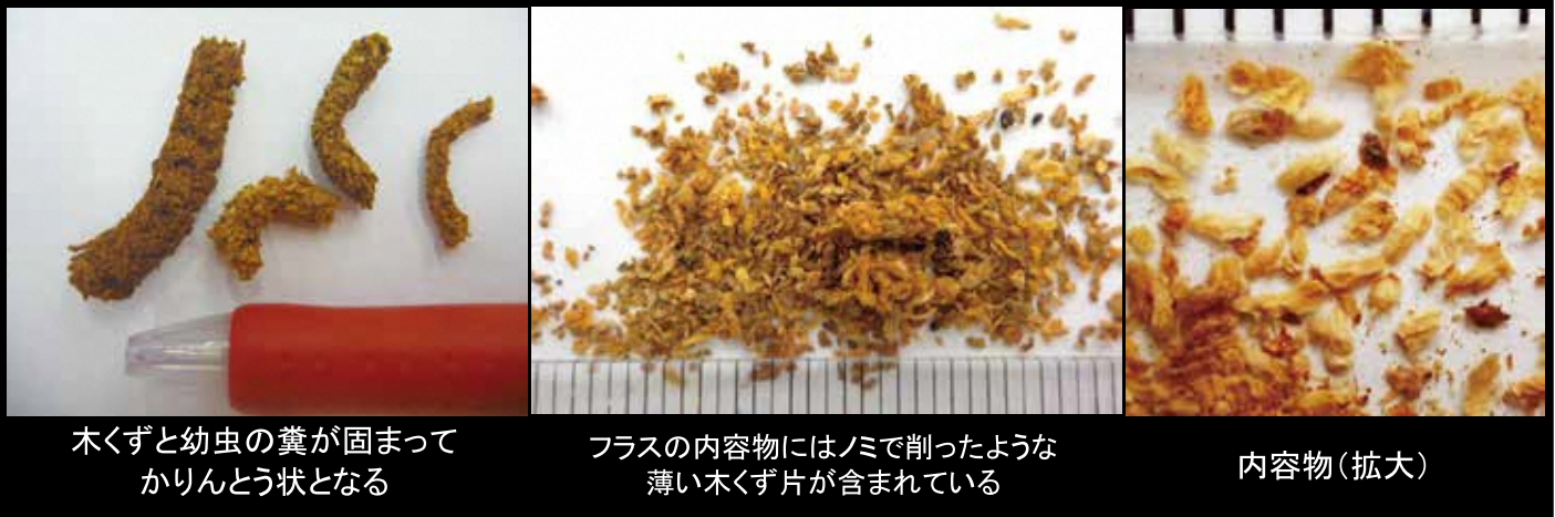
木くずと幼虫の糞が固まって かりんとう状となる