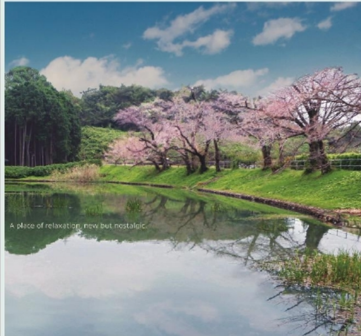
A place of relaxation, new but nostalgic.