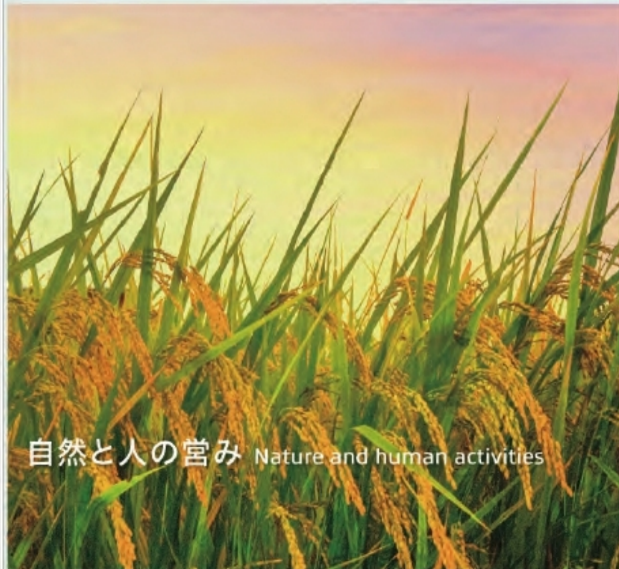
自然と人の営み Nature and human activities