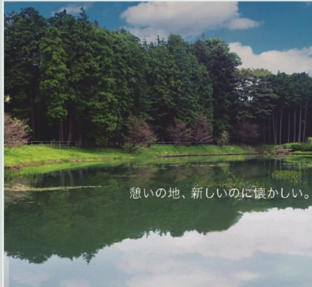
憩いの地、新しいのに懐かしい。