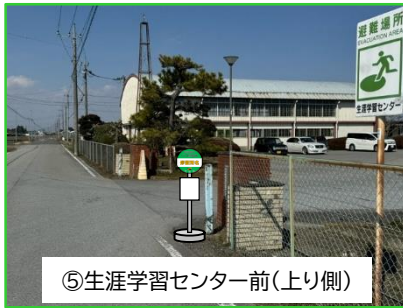
⑤生涯学習センター前(上り側)