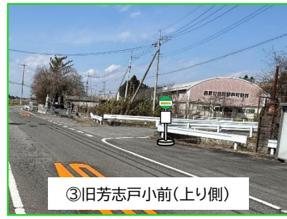
③旧芳志戸小前(上り側)