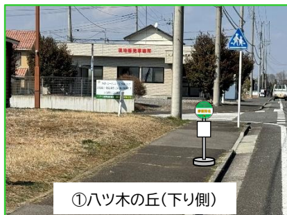
①ハツ木の丘(下り側)