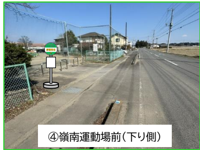
④嶺南運動場前(下り側)