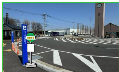
⑦芳賀工業団地トランジットセンター

※写真の停留所位置と実際の設置場所とは若干異なる場合があります。 ※生涯学習センター前は上り側のみ設置します。(下り側も乗降可能です)