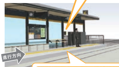
▲足元の案内サイン