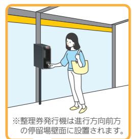
※整理券発行機は進行方向前方の停留場壁面に設置されます。