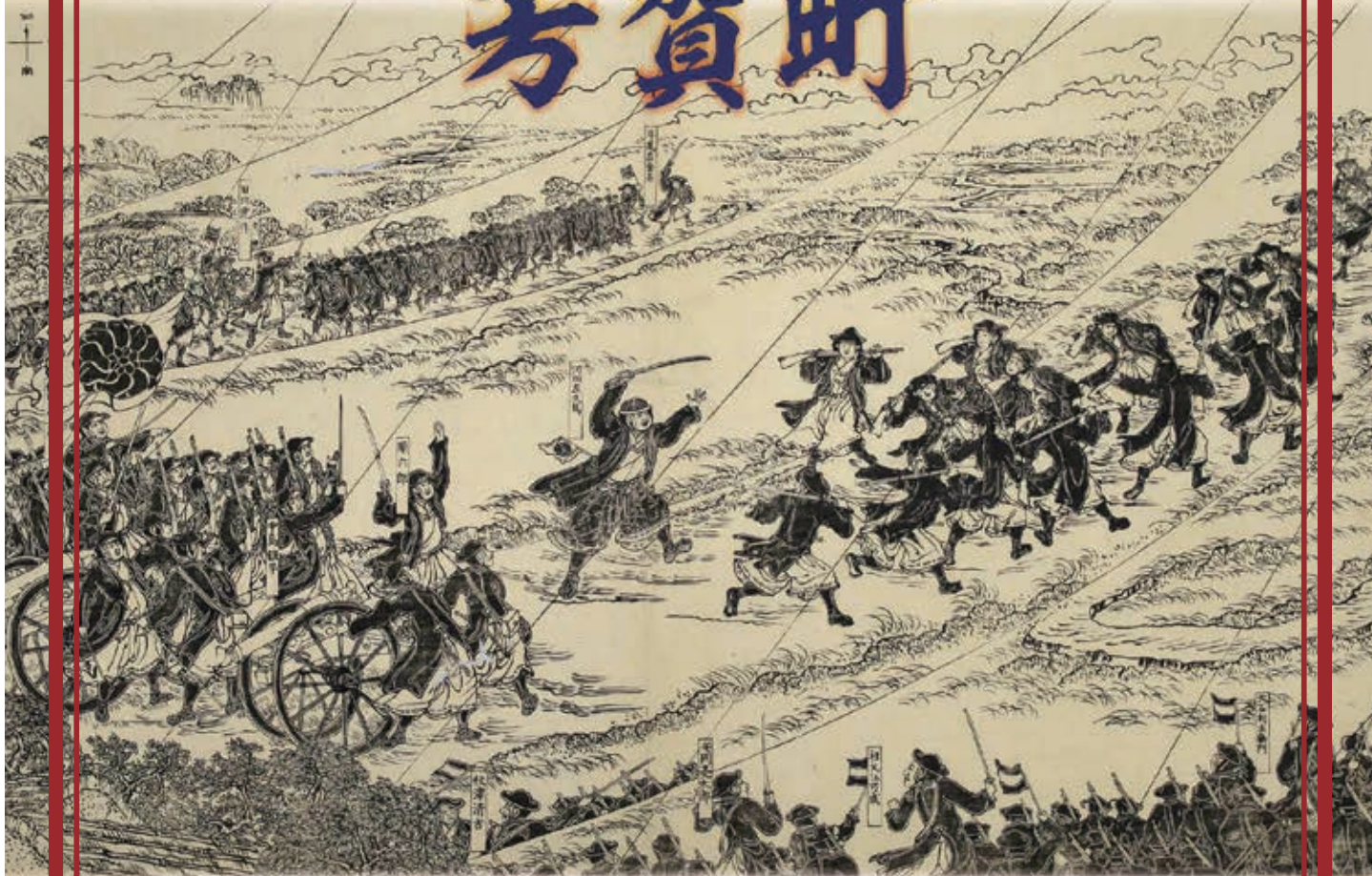
戊辰戦記絵巻物 野州安塚戦争之図其二(個人蔵)