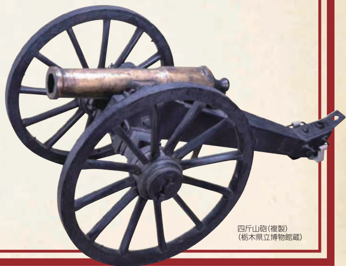
四斤山砲(複製) (栃木県立博物館蔵)

※展示の日程や開館時間などは、今後の諸事情により変更になる場合があります。お電話、ホームページなどでご確認ください。