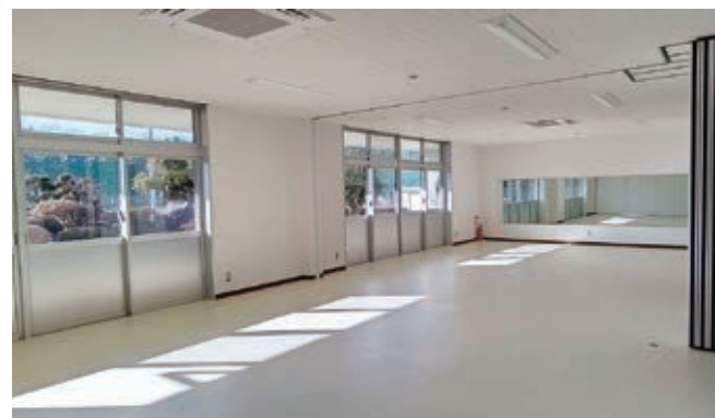
▲会議室1~3 (移動間仕切りのため、つなげて使用可能)