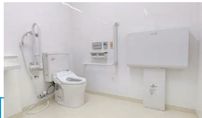
▲多目的トイレを新設 (おむつ交換台あり)