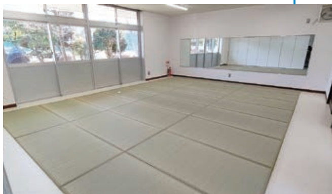
▲会議室1 (ユニット畳使用時)