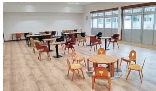
▲大会議室 (通常はフリースペースとして開放)