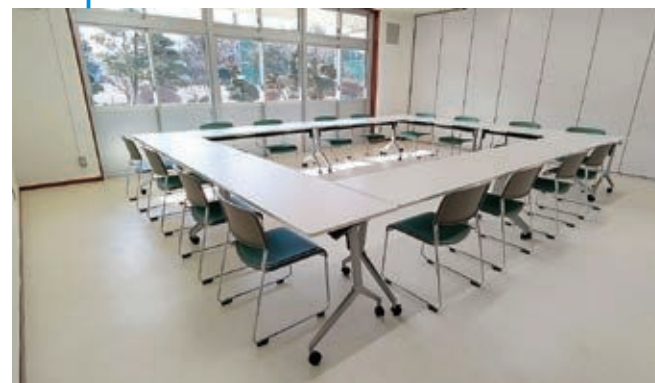
▲会議室3 (会議での使用時)