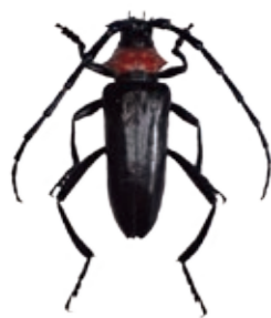
クビアカツヤカミキリの成虫

「クビアカツヤカミキリ」の体長は2~3cmで、体全体は光沢のある黒色で赤色の前胸が目立ちます。1匹の雌が200~300個の卵を産み、孵化して2年で成虫になります。サクラ、ウメ、モモなどのバラ科樹木に寄生します。幼虫が樹木内部を食い荒らすため、寄生された樹木は枯死してしまいます。