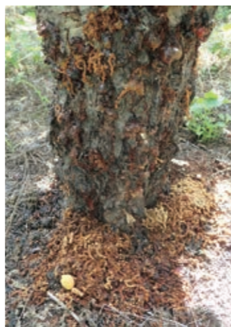
▲フラス (木くずとふんがまざったもの)