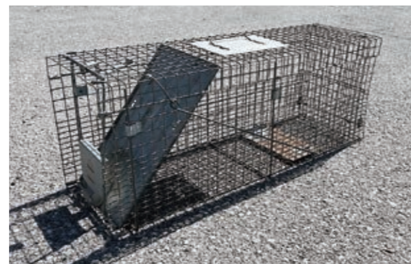
▲農政課で貸し出しを行っている箱わな

ホームセンター等で小型箱わなが販売されていますが、それらを使い、無免許・無許可でのわなの設置や野生鳥獣の捕獲等を行うと、法律に違反するため、罰則(1年以下の懲役または100万円未満の罰金)が適用される可能性があります。