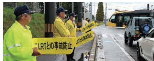
▲交通安全運動の様子

芳賀・宇都宮LRT開業により、地域の交通環境が大きく変化しました。より一層、ゆとりを持った運転や通行を心掛け、事故のない安全・安心な町を目指しましょう。