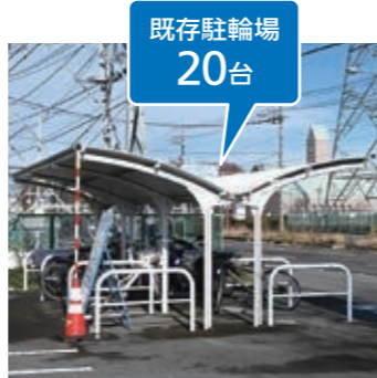
▲パーク&ライド駐車場