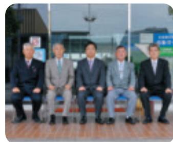
議会広報常任委員会

統一地方選も終わり、水田が緑のジュウタンへと変わりました。芳賀町議会も我々新人3人を加え、15人での新たな船出となりました。