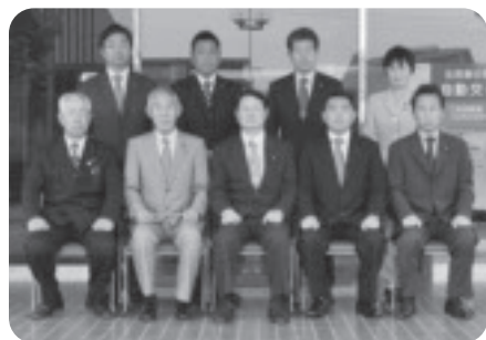
議会運営委員会委員