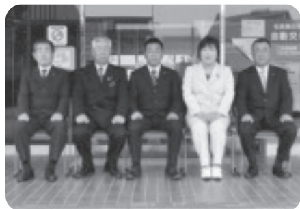
産業建設常任委員会委員