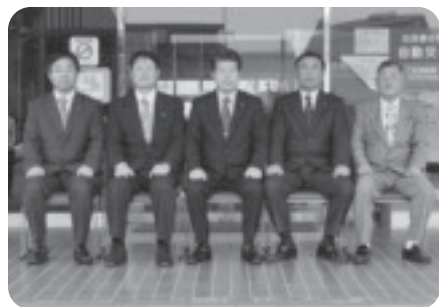
教育民生常任委員会委員