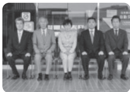
総務常任委員会委員