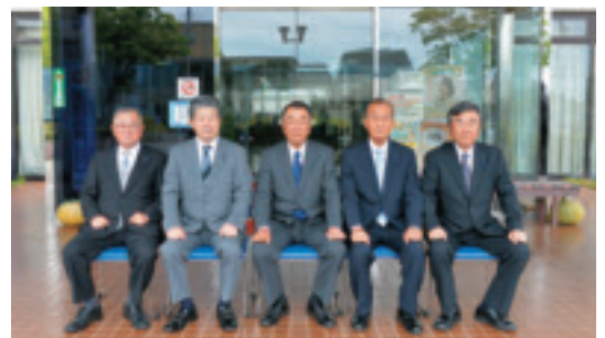
議会広報常任委員会