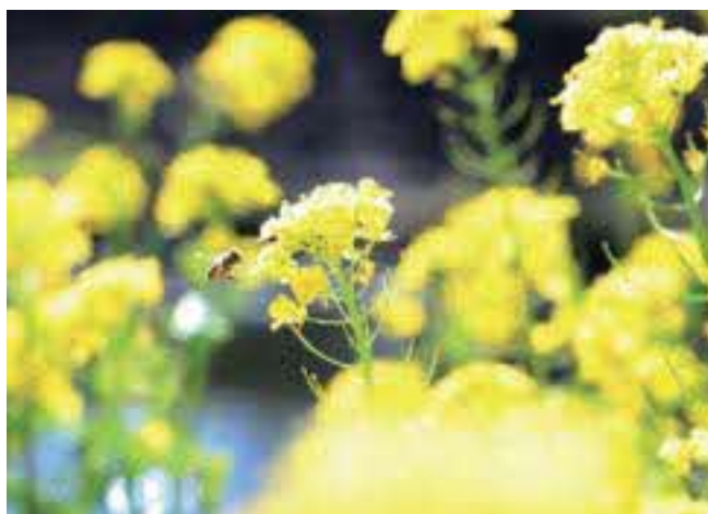
▲春の便り～菜の花とミツバチ～