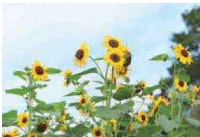
▲元気いっぱい咲くひまわり