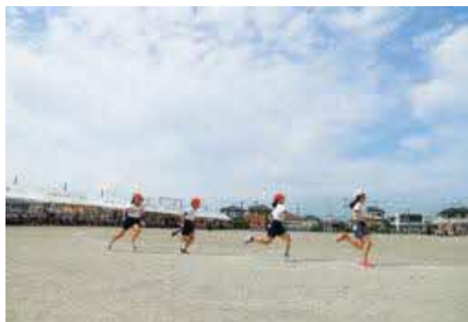
▲秋晴れの運動会(芳賀東小)