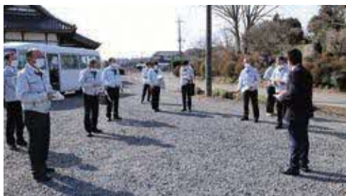
▲防火水槽設置予定地(西水沼地内)

防火水槽設置工事(予定地:西水沼地内) 832万円 旧稲毛田小学校擁壁工事設計委託料 70万円