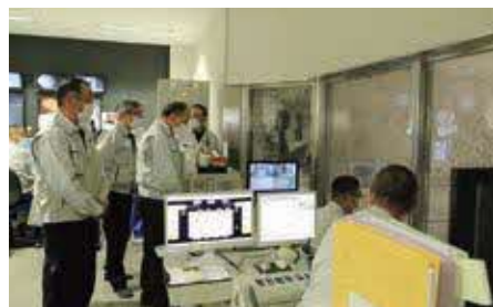
▲芳賀地区エコステーション

芳賀地区エコステーションでは宇都宮市のごみ処理施設「クリーンパーク茂原」で2月1日に発生した火災により、宇都宮市清原地区のごみの受け入れを開始しており、現地を確認してきました。