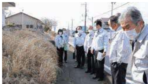
▲旧稲毛田小学校擁壁を調査

芳賀地区エコステーションでは宇都宮市のごみ処理施設「クリーンパーク茂原」で2月1日に発生した火災により、宇都宮市清原地区のごみの受け入れを開始しており、現地を確認してきました。