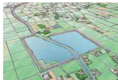
▲遊水地完成予想図

芳賀遊水地に多目的広場や遊歩道を整備するとともに、道の駅はがと芳賀遊水地をつなぐ桜堤遊歩道の整備を進め、憩いの場と新たな桜の名所の創出を図ります。