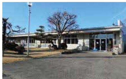
▲改修工事が行われる 生涯学習センター水橋分館