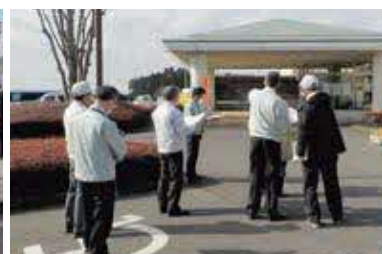
▲ロマンの湯での視察の様子