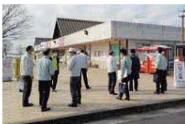
▲道の駅はがでの視察の様子