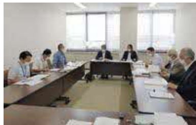
▲書類審査(環境対策課)