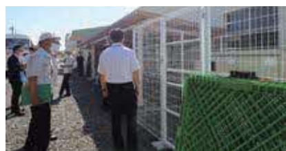
▲農業者トレーニングセンターを現地調査

農業者トレーニングセンターの消火栓ポンプユニットの改修工事を行いました。交流電気で消火栓ポンプを起動し、停電時は自家発電装置で動く現在の主流仕様に変更しました。