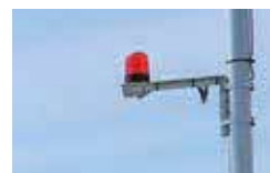
▲設置された赤色灯