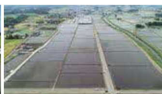
▲整備された北部第2地区ほ場