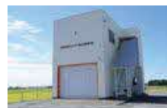
▲工事が完了した2-3(芳志戸)