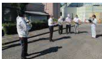
▲LRTの整備状況を現地調査