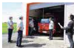
▲改修工事が完了した2-3(芳志戸)の現地調査

2-3(芳志戸)、3-1(東水沼)の2か所の改修工事を行いました。主な工事内容は、外部シーリング工事、塗装工事および内装工事です。