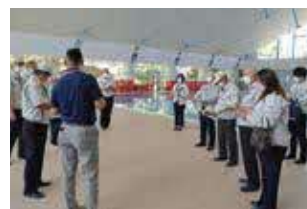
▲B&G海洋センタープール天井改修工事の現地調査