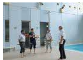
▲現地調査(B&G海洋センター)

今後、芳賀第2工業団地の立地予定の企業が一日も早く工場施設を建築されまして、LRTによる通勤や通学での利用や交流人口の増加により、益々、芳賀町の認知度を高めて活力あふれる「芳賀のまち」を一緒に創造していただきたいと思います。