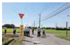
▲交通危険箇所(下高根沢)の現地調査

交通危険箇所等赤色回転灯設置工事を実施しました。LED式で従来のもよりも明るく、点灯可能時間が長くなっています。