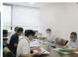
▲書類審査(環境対策課)