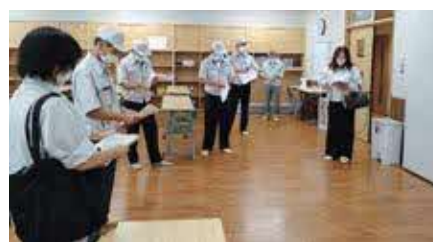
▲新築された学童施設の現地調査

農業者トレーニングセンター内で実施していた芳賀東小区の学童保育ですが、祖陽が丘への転入者の増加等により、利用者増加が見込まれるため、芳賀東小学校の敷地内に新たに学童保育施設を建築し、令和4年1月から開所しました。