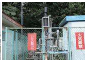
▲ポンプ交換を行った第1号源泉