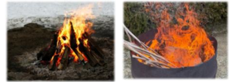
【たき火のイメージ】

・降水が少なく、乾燥している気象状況下において、『林野火災注意報』を発令し、屋外での火の使用について注意を呼び掛けます。加えて、強風が吹く状況下では『林野火災警報』を発令し、屋外での火の使用を制限することで、林野火災の発生及び延焼拡大を予防します。