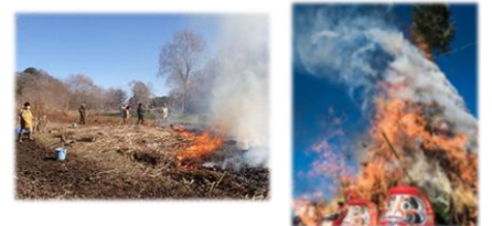
【たき火に該当しないイメージ】