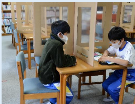
▲地域の協力により作ったついたて