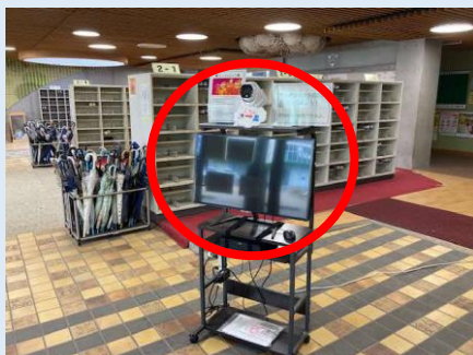
▲サーマルカメラ（昇降口）