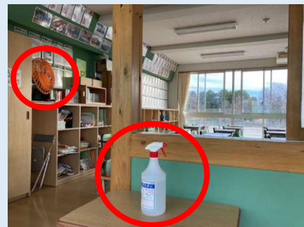
▲手指消毒液と扇風機