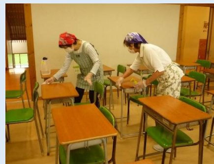
▲地域の方々による消毒ボランティア